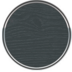
ST 508 UV Antrasit Gri UV Anthracite Grey