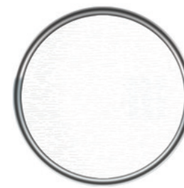
ST 517 UV Beyaz UV White