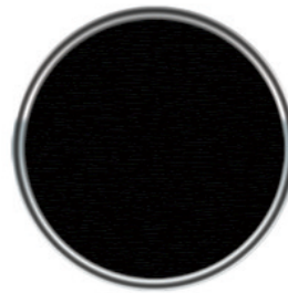
ST 510 UV Siyah UV Black