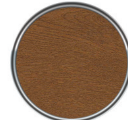
ST 500 UV Altın Meşe UV Golden Oak

Exterior / 200 Micron Dışmekan / 200 Micron