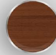
DB - 93 Tik Teak