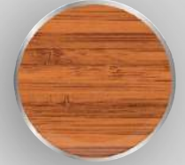
DB - 86 Antik Bambu Antique Bamboo