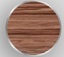
DB - 99 Açık Abanoz Light Ebony