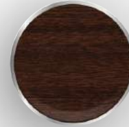
DB - 95 İnce Ceviz Nussbaum