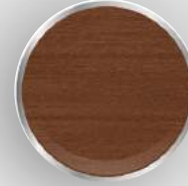
DB - 91 İnce Altın Meşe Fine Wood