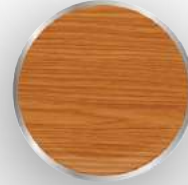
DB - 94 Açık Altın Meşe Kiefer Line Wood