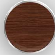
DB - 90 Kalın Altın Meşe Line Wood