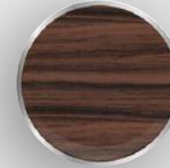
DB - 98 Koyu Abanoz Dark Ebony